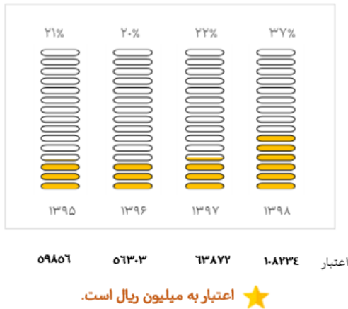
اعتبار طرح کاربردی پردیس در طی ۴ سال اخیر