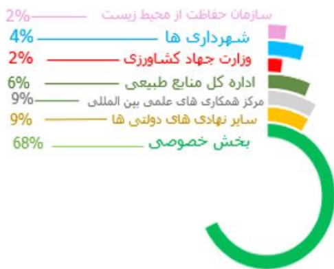
توزیع کارفرمای طرح های کاربردی پردیس در سال ۱۳۹۸

تعداد تفاهم نامه های پردیس در سال ۱۳۹۸ ۱۱ فقره